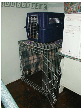
Onderin staat een bench, bovenop staat een varikennel.

Nu is de pup bij mij gewend in de bench en in de varikennel te zitten, met of zonder mensen in de buurt en met of zonder de andere honden in de buurt. Dit kunnen ze omdat ze vertrouwen hebben in hun omgeving. Als ze net bij je aankomen, hebben ze dat vertrouwen niet. Ze hebben net een traumatische ervaring achter de rug: moeder kwijt, nestgenootjes kwijt, de vertrouwde omgeving, bekende mensen. Dat vertrouwen moet je eerst weer opbouwen voor je er gebruik van kunt maken. Niet alleen laten dus, zeker niet de eerste dag. Zelf houd ik ze altijd de eerste twee dagen voortdurend in het oog en daarna begin ik ze langzaam alleen te laten.