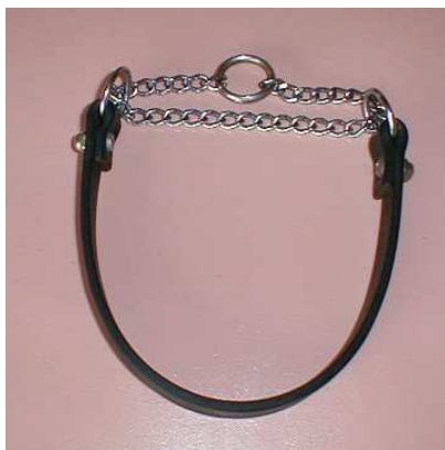
← Engelse slipketting

Ik stel ze het liefst zo af dat deze halsband net helemaal dichtgetrokken kan worden op het smalste punt van de hals zonder daar te corrigeren – hij corrigeert dan wel als hij lager op de hals hangt, maar kan de hond niet wurgen als hij idioot doet.