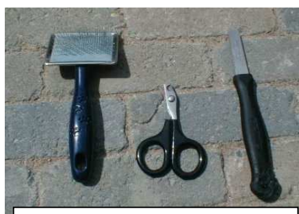
V.l.n.r. herderharkje, nagelschaartje, trimmes