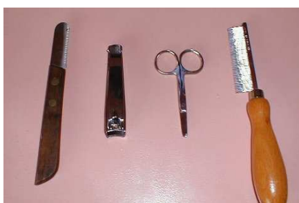
V.l.n.r. trimmes, nagelknippertje, babyschaartje, kam.

Lakelandjes hoeven normaal gesproken niet gewassen te worden en meestal doet het meer kwaad dan goed. De vacht wordt zacht en neemt daardoor meer vuil op. Gevolg: je wilt hem weer wassen om dat op te lossen. Een uitzondering is natuurlijk als je hondje in iets echt vreselijk vies heeft liggen rollen of iets dergelijks. Zwemmen / spelen in een bijna droge sloot geeft ook een vreselijke lucht, maar afspoelen met schoon water (of laten zwemmen in schoner water) helpt al veel en als hij droog is, doet een goede borstelbeurt wonderen. De hond wassen omdat hij jeuk heeft is géén goed idee. Dierenartsen hebben er nogal een handje van om je allerlei shampoos aan te smeren, maar voor de Lakeland en de meeste andere honden doen deze meer kwaad dan goed. De hond in zee laten zwemmen en hem in schoon zand laten graven of rollen helpt veel beter (als hij weer droog is zorgvuldig uitborstelen) en bij gebrek aan zeewater in de buurt wil laten zwemmen in een natuurlijk meertje of beekje ook nog wel een goede oplossing zijn. Meer details over trimmen, maar ook over specifieke hondziektes ed. vind je in de meeste goede hondeboeken en natuurlijk in het Nederlandstalige Lakelandterrier boek van Cees van Benthem en Hugo Stempher.